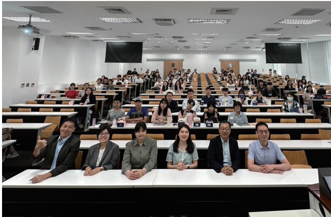
APEC研究中心團隊與臺大師生合影。