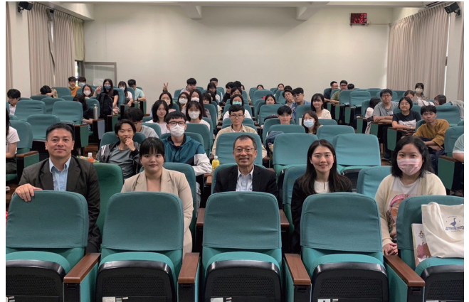
APEC研究中心團隊與成大師生合影。